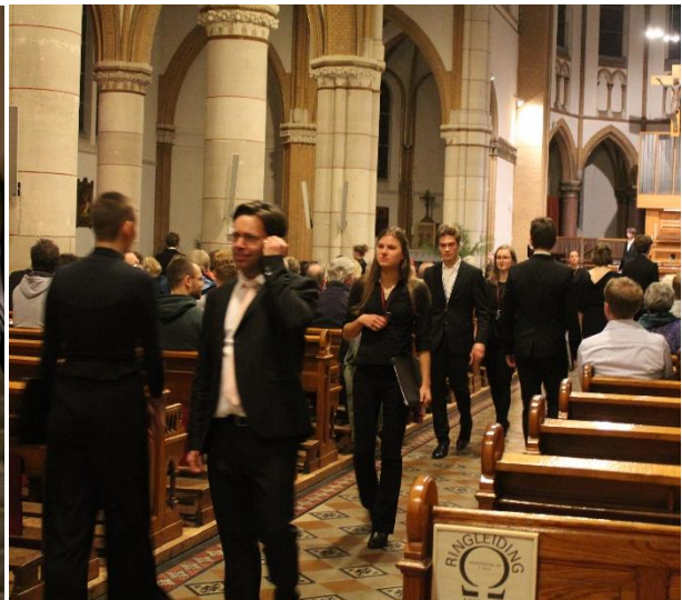
Figuur 1 Het koor zingt verspreid over de zaal

Het NSK brengt studentenzangers uit heel Nederland in contact met een tak van muziek waar ze niet vaak in aanraking mee komen: de hedendaagse klassieke muziek. Ook voor veel concertbezoekers kan het een eerste kennismaking met moderne klassieke muziek zijn. Daarom doen we er veel aan om onze optredens laagdrempelig en toegankelijk te maken, zodat de concerten voor de bezoekers een prikkelende en bovenal aangename ervaring zijn. Kenmerkend voor het NSK is de combinatie van muzikale kwaliteit, aandacht voor presentatie én choreografische elementen. De zangers zingen bijvoorbeeld verspreid door de zaal, dichtbij het publiek of ontwikkelen een verrassende kooropstelling passend bij het stuk. De muziek krijgt door deze beweging en regie een extra dimensie en de