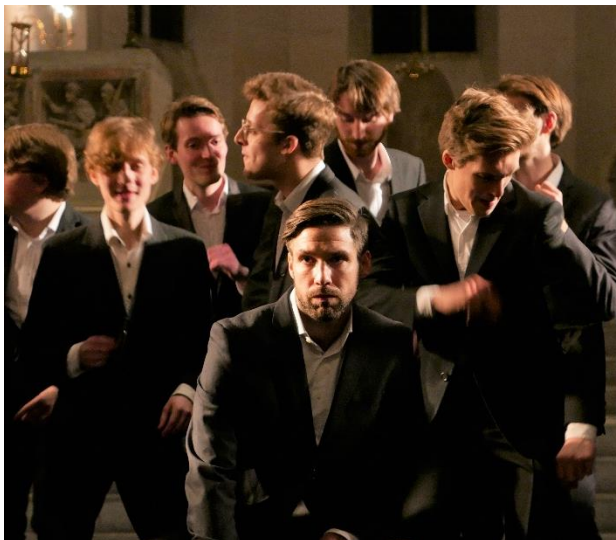
Figuur 2 Choreografie op slotstuk "Happy", 2019