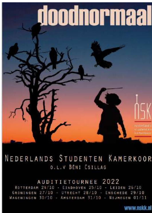
Auditieposter, ontwerp Bart Hermans

vullen (aangezien dit bestond uit een kleinere bezetting in verband met de anderhalve meter afstand).