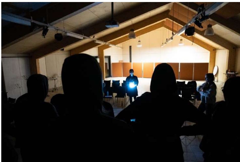
Repetitie voorafgaand aan de try-out in het Bostheater van De Zonnewende

Tijdens de repetitieweek wordt elke dag van 10:00 – 21:00 zeer intensief gerepeteerd. Naast de vocale ontwikkeling en het leren van het repertoire nam dit jaar de regie een centrale plek in: alle stukken werden zoveel mogelijk gerepeteerd met alle bewegingen die tijdens de concerten gemaakt zouden worden. In de prachtige omgeving van Sint Michielsgestel hebben we ook veel tijd gehad voor de onderlinge sociale binding. Doordat de planning van het project in januari nog op de schop moest, kwam het niet anders uit dan dat de repetitieweek tussen repetitieweekend I en II in zat. Normaal gesproken is de repetitieweek het laatste onderdeel van het repetitieproces, en ga je vanuit Sint Michielsgestel door naar de première in Rotterdam. Doordat De Zonnewende nu alleen nog beschikbaar was van 11 – 18 maart, zijn we relatief vroeg in een heel intensieve week beland waarin de zangers elkaar, de muziek en de regie erg goed leerden kennen. De traditionele try-out aan het einde van de week, waar bezoekers uit Sint Michielsgestel trouw heen komen, was dus al vroeg in het repetitieproces een moment om naartoe te werken.