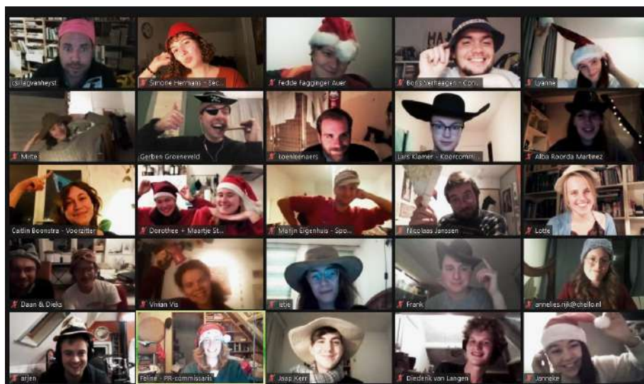
Eerste samenkomst van het koor in december 2020

Het repetitieproces bestond zoals elk jaar uit een introductiedag, drie repetitieweekenden en een repetitieweek. Normaal gesproken vindt de repetitiedag in december plaats, de repetitieweekenden in januari en de concerten in februari. Door de uitbraak van corona begin 2020 hebben wij na veel tussentijdse verplaatsingen moeten concluderen dat het verplaatsen van het project naar 2022 de enige veilige optie was.