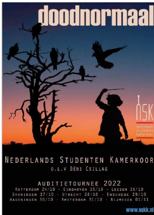
Auditieposter, ontwerp Bart Hermans

vullen (aangezien dit bestond uit een kleinere bezetting in verband met de anderhalve meter afstand).