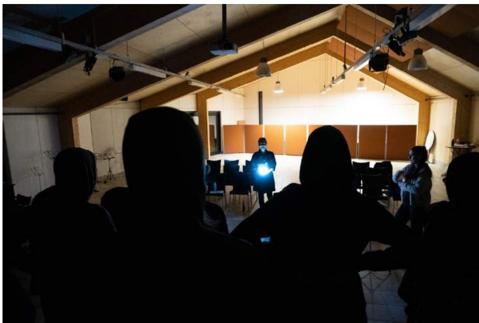
Repetitie voorafgaand aan de try-out in het Bostheater van De Zonnewende

Tijdens de repetitieweek wordt elke dag van 10:00 – 21:00 zeer intensief gerepeteerd. Naast de vocale ontwikkeling en het leren van het repertoire nam dit jaar de regie een centrale plek in: alle stukken werden zoveel mogelijk gerepeteerd met alle bewegingen die tijdens de concerten gemaakt zouden worden. In de prachtige omgeving van Sint Michielsgestel hebben we ook veel tijd gehad voor de onderlinge sociale binding. Doordat de planning van het project in januari nog op de schop moest, kwam het niet anders uit dan dat de repetitieweek tussen repetitieweekend I en II in zat. Normaal gesproken is de repetitieweek het laatste onderdeel van het repetitieproces, en ga je vanuit Sint Michielsgestel door naar de première in Rotterdam. Doordat De Zonnewende nu alleen nog beschikbaar was van 11 – 18 maart, zijn we relatief vroeg in een heel intensieve week beland waarin de zangers elkaar, de muziek en de regie erg goed leerden kennen. De traditionele try-out aan het einde van de week, waar bezoekers uit Sint Michielsgestel trouw heen komen, was dus al vroeg in het repetitieproces een moment om naartoe te werken.