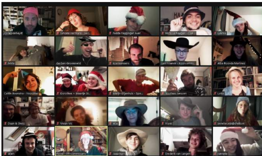
Eerste samenkomst van het koor in december 2020

Het repetitieproces bestond zoals elk jaar uit een introductiedag, drie repetitieweekenden en een repetitieweek. Normaal gesproken vindt de repetitiedag in december plaats, de repetitieweekenden in januari en de concerten in februari. Door de uitbraak van corona begin 2020 hebben wij na veel tussentijdse verplaatsingen moeten concluderen dat het verplaatsen van het project naar 2022 de enige veilige optie was.