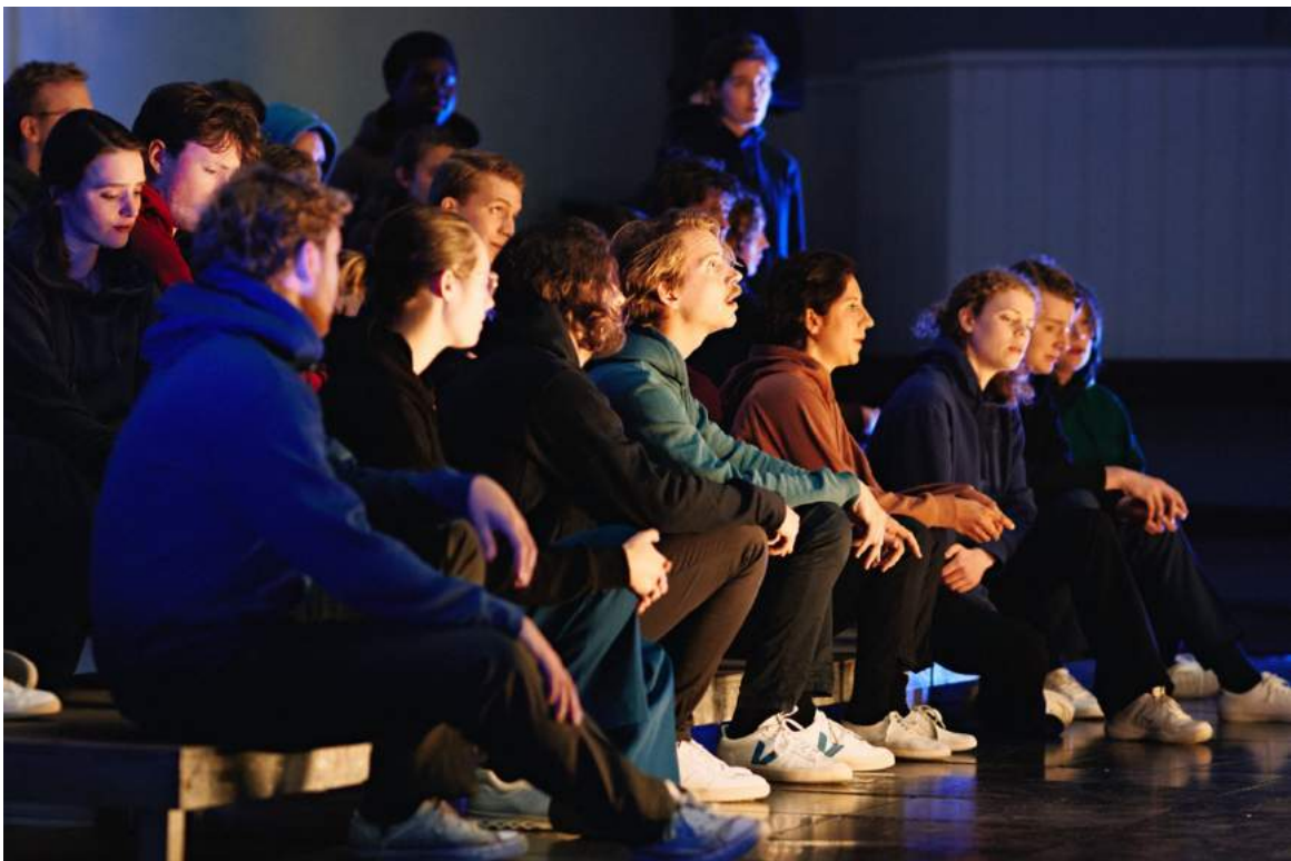
De opstelling tijdens "O Tod, wie bitter bist du" van Max Reger.

De rol van de regisseur beveelt het DB 2020-2022 van harte aan aan komende besturen. Het werken aan de regie draagt bij aan groepsvorming, stemgebruik en gezamenlijke intonatie en koorklank. Tijdens het repetitieproces hebben deelnemers middels diverse oefeningen geleerd om gelijktijdig te zingen en te bewegen, en zich hierbij op wisselende afstand van elkaar te begeven. Doordat de zangers gewend raakten aan het zingend bewegen voelden ze zich hier gaandeweg steeds vrijer in, wat het vrije stemgebruik en de gezamenlijke klank ten goede kwam.