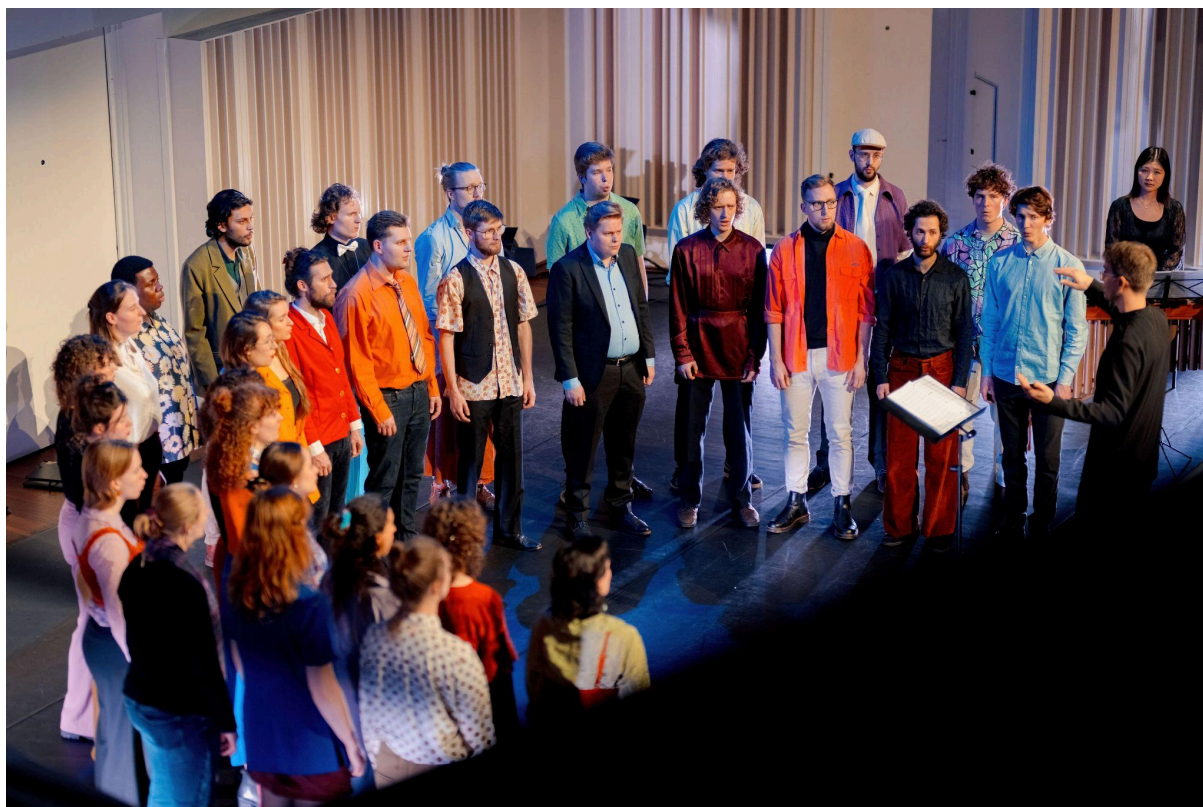
NSK 2024, Muziekgebouw Eindhoven

Nederlands Studenten Kamerkoor postbus 19171 3501 DD Utrecht www.nederlandsstudentenkamerkoor.nl