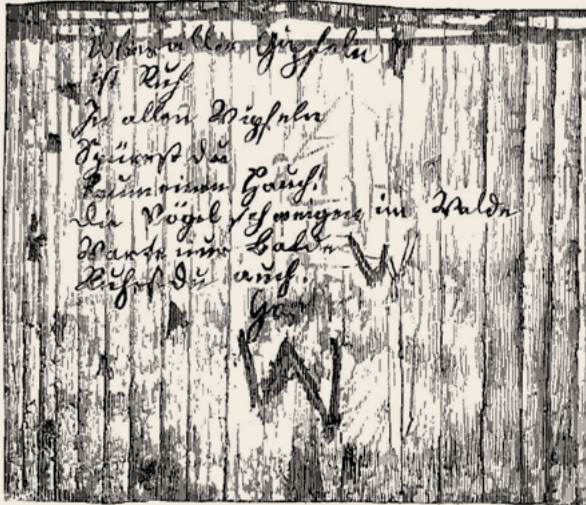
Goethe's Handschrift im Ricketshu-Häuschen.